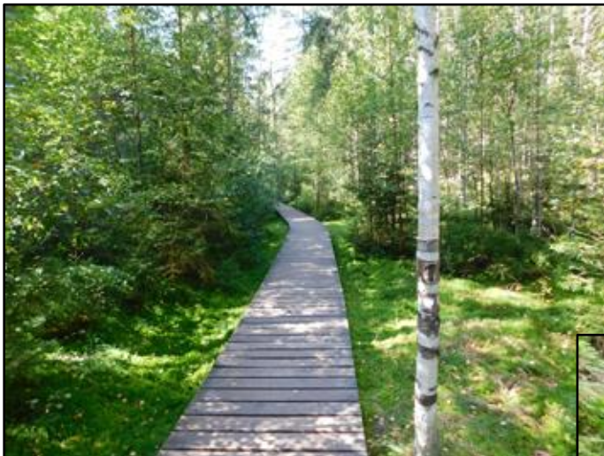
I za parného suchého léta žhne Vlčí rokle zelení díky vlhkosti a rašelinám držícím se na dně mezi pískovcovými kvádry

vpravo: Druhý a nevysychající pramen Metuje zhruba 1 km od louky v Kalousích, kde se po deštích objevuje pramen první