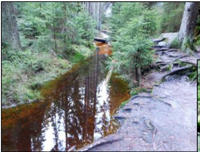
Vlčí rokle, údolí kdysi vyhloubené ve skalách vodami Metuje, dnes ladně plynoucí Skalní potok