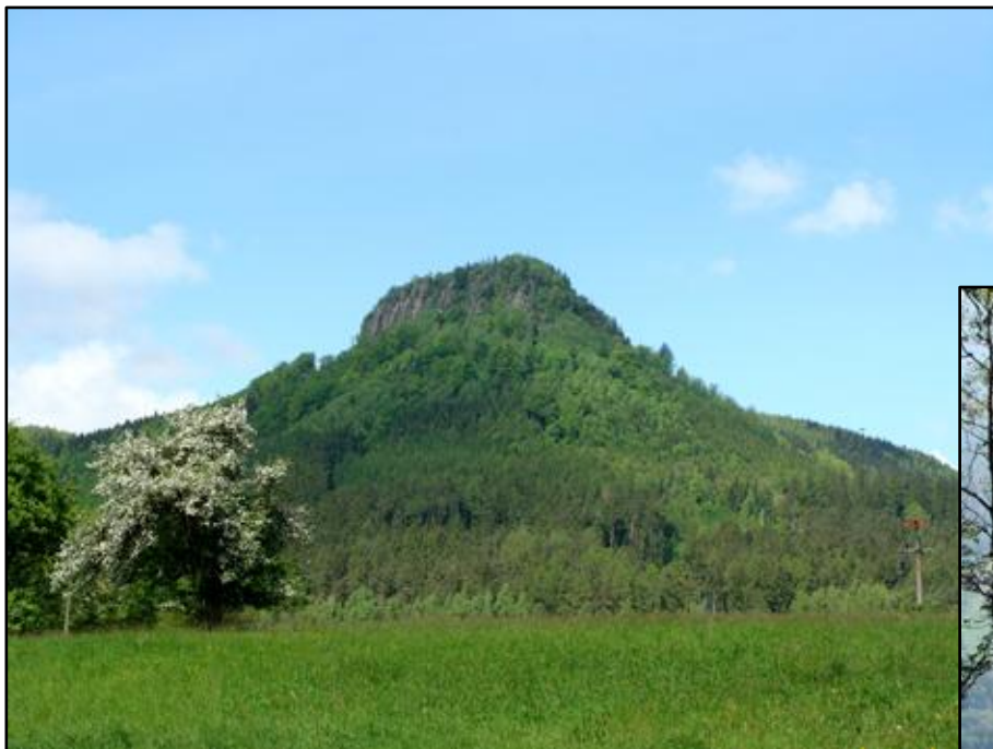
vlevo: Koruna (Broumovské stěny)