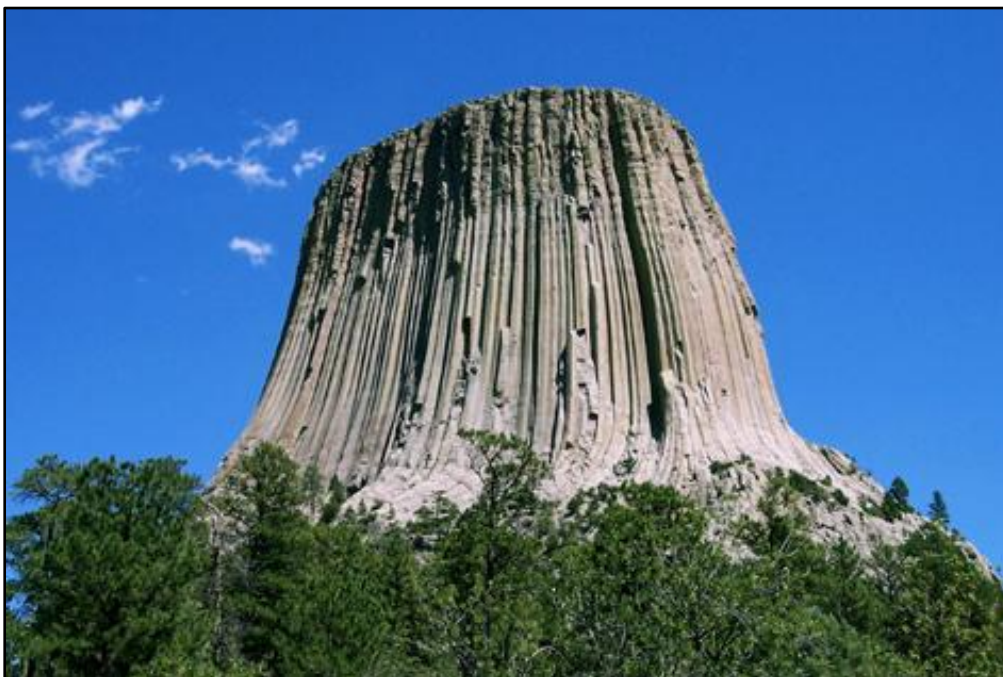
vlevo: Devils Tower (USA, Wyoming)