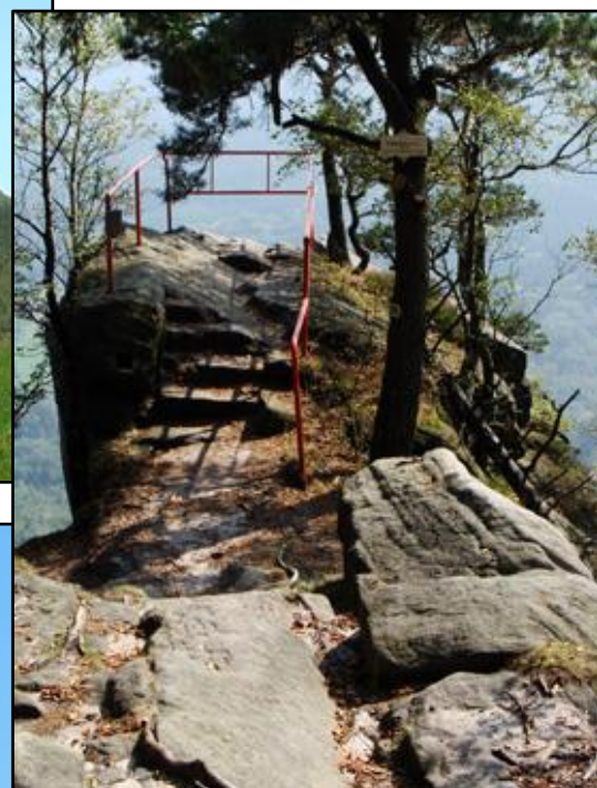
nahoře: Vyhlídka na vrcholu Koruny (východní hrana)