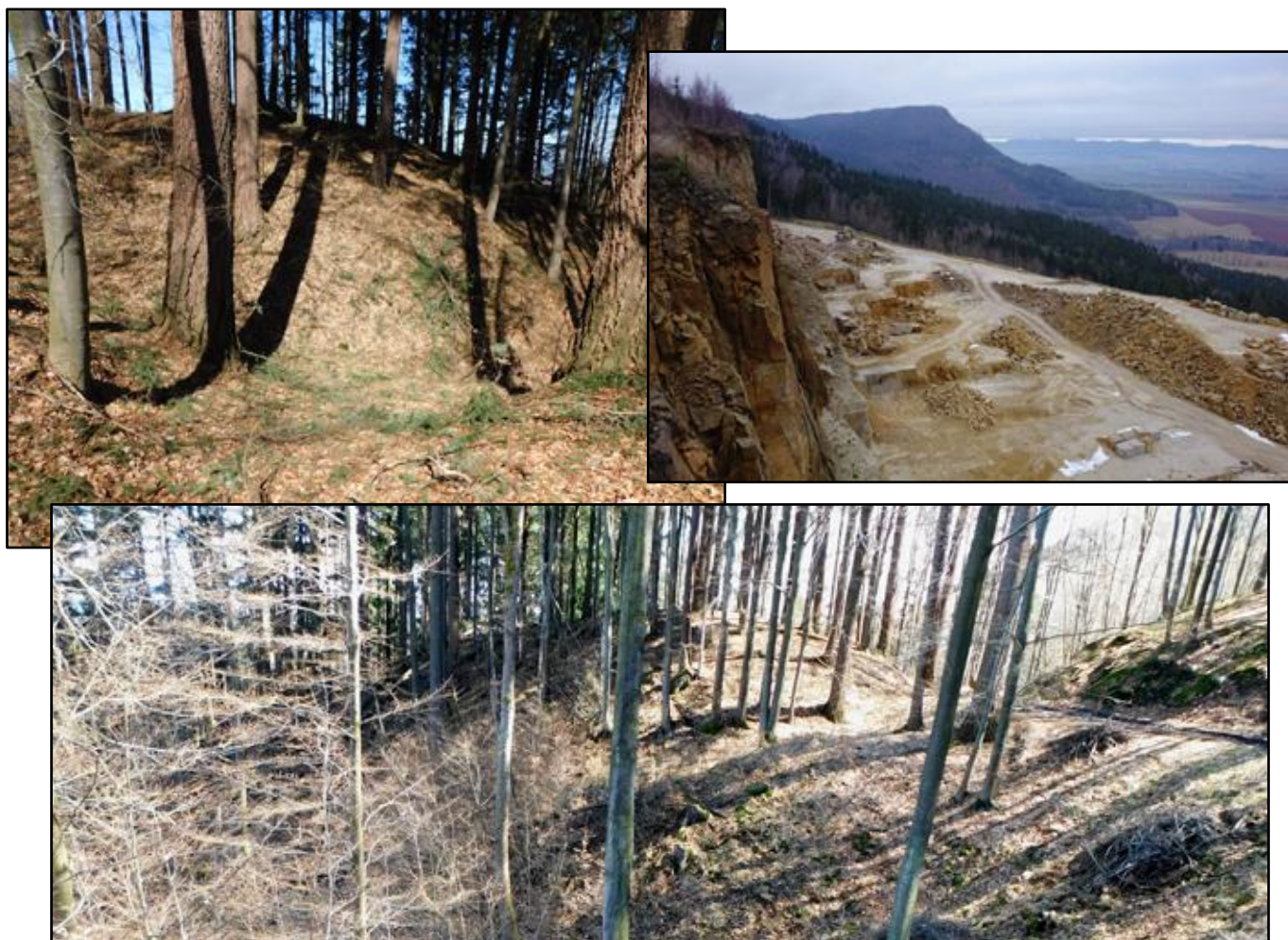
vlevo a dole: Pozůstatky hradního valu hradu Raubschloss vpravo: Lom Božanov, za ním vyčnívá hrana Koruny a na obzoru Javoří hory

hnědé polohy, šmouhy nebo skvrny. Je převážně středně a stejnoměrně zrnitý, místy se ale vyskytují nepravidelně omezené polohy hruběji zrnité. Makroskopicky jsou v něm rozeznatelná zejména světle šedá zrna křemene, bělavá zrna plagioklasů (sodno-vápenatých živců) a růžová až červená zrna draselných živců (ortoklasu). Podle minerálního složení a kaolinizované mezerní hmoty (tmelu) je možné horninu označit za středně zrnitý arkózový pískovec, což potvrzují i výsledky chemických rozborů. Z technického hlediska patří božanovský pískovec k našim nejkvalitnějším pískovcům. V božanovském lomu se těží způsobem blokové těžby. Vytěžené bloky o průměrné velikosti okolo 2 m 3 se odvázejí na zpracování do kamenické provozovny v Teplicích nad Metují. Ostatní surovina se zpracovává přímo v lomu na hrubé kamenické výrobky (štípané hranoly a kostky, regulační kámen) a odpad se drtí na materiál k posypu a údržbě cest. Božanovský pískovec měl a má široké uplatnění ve stavebnictví, v architektuře, v sochařství i při obnově památek. Ve velkém rozsahu byl použit na obnovy pražských historických budov (Týnského chrámu, Lichtenštejnského paláce, Trojského zámku), i na rekonstrukce opláštění a pilířů Karlova mostu. Pro své estetické i technické vlastnosti byl božanovský pískovec použit, a je stále bohatě využíván, i na současné architektonické realizace mnohých moderních budov v Čechách i v zahraničí.