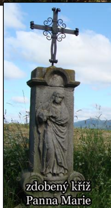
zdobení kříž Panna Marie