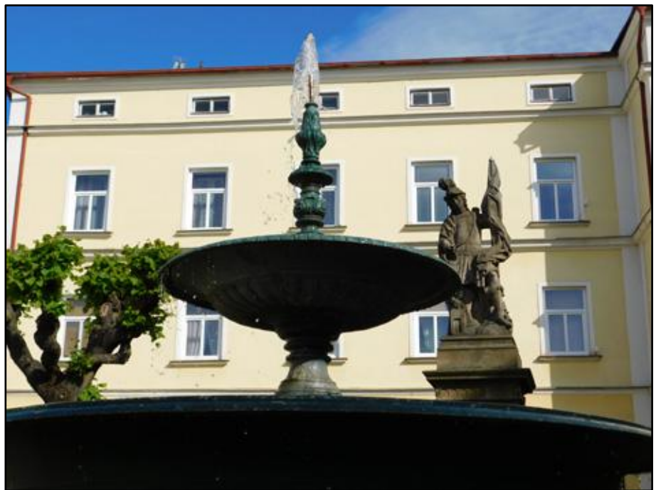
Malé náměstí v Broumově (kdysi zvané Floriánovo)

Stará panna bydlela na Malém náměstí (A), kterému se kdysi říkalo Floriánské, neboť na náměstíčku se dodnes nachází socha svatého Floriána, kterého mezi soškami svatých poznáte vždy tak, že má po svém boku džbán, či jinou nádobu, ze které vylévá vodu. Florián zahynul v Lorchu (menší rakouská vesnička), 4. května 304 a stal se prvním rakouským katolickým mučedníkem, a posléze světcem. V té době Horní Rakousy patřily do římské provincie Noricum, později začleněné k Panonii. V letech 303 a 304 vydal římský císař Dioklecián verdikty opravňující popravu křesťanů. Stalo se tak i poblíž Lince v Lorchu. Když se o tom Florián dověděl, spěchal jim do Lorchu na pomoc. Byl však prozrazen, zatčen a mučen, aby se zřekl Krista. Jelikož tak neučinil, byl vydán soudem do rukou kata. Onoho dne 4. května mu byl na krk přivázán mlýnský kámen a Florián byl svržen do řeky Enže poblíž Lorchu. Jeho tělo našla vdova Valérie a