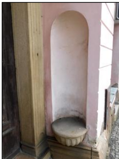
(vlevo) dochovaná sedadla v ostění (u vchodů) měšťanských domů v Broumově