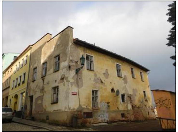
(nahore) žel poničený dům č. 175 v roce 2022 (vlevo) dům č. 167 v roce 2022 (dole) žel poničený dům č. 205 v roce 2022