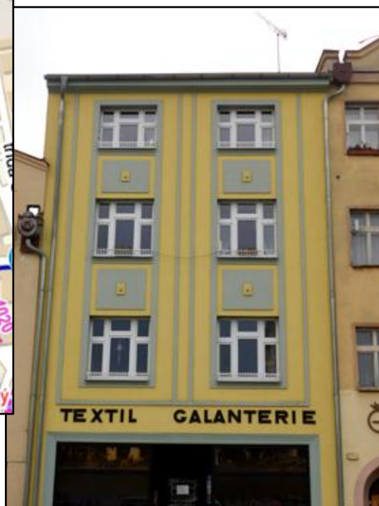
(vpravo) dům č. 114 v roce 2022)