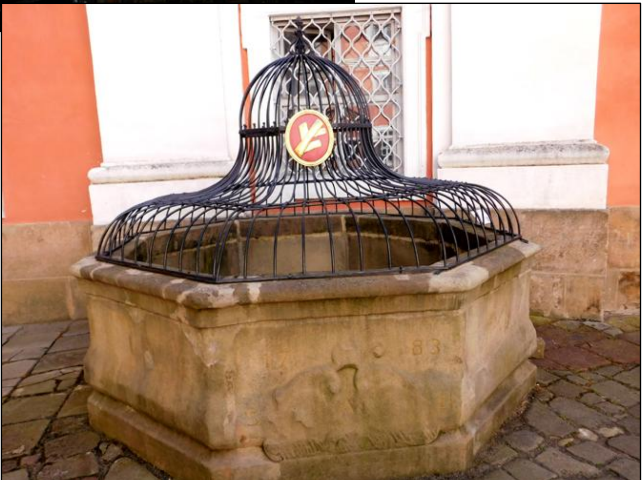
(dole) Studna na nádvoří broumovského benediktinského klášteře.