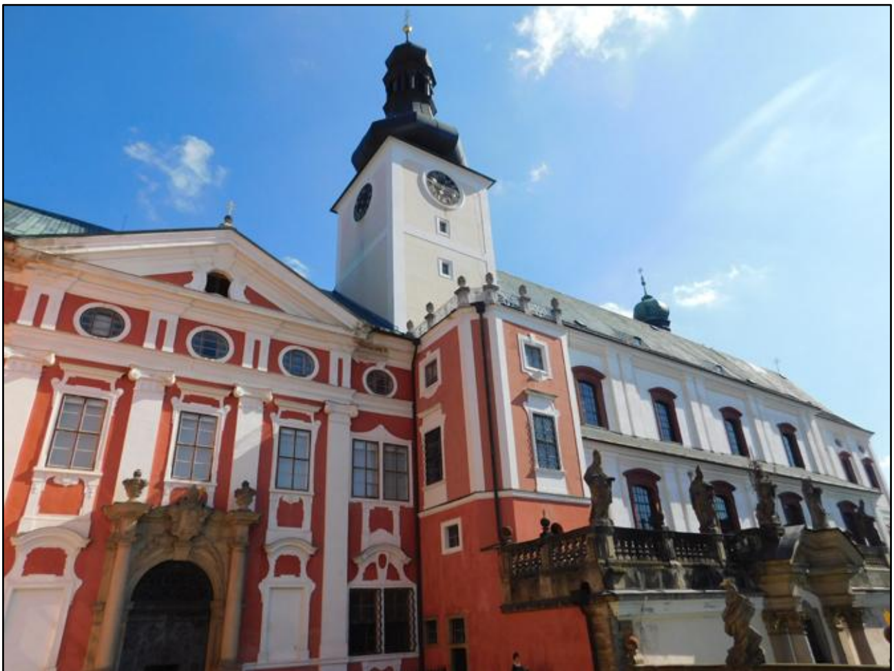
klášterní Kostel svatého Vojtěcha v benediktinském klášteře v Broumově