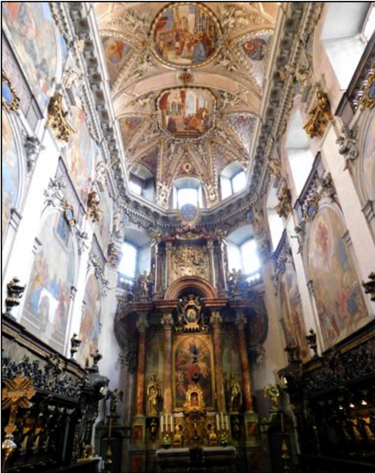
(vlevo) Vnitřní výzdoba Kostela svatého Vojtěcha v benediktinském klášteře v Broumově.