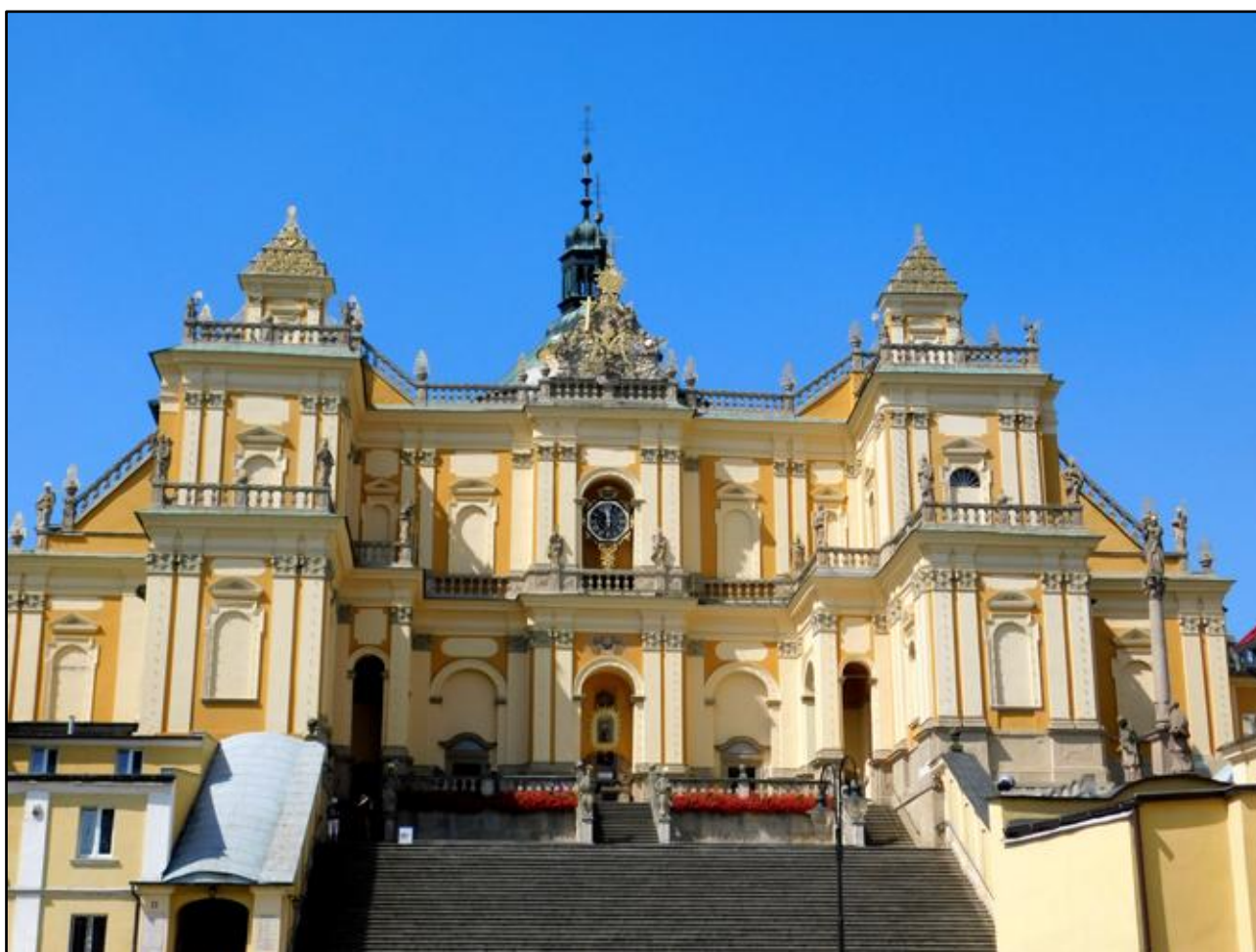
Bazilika Navštívení nejsvětější Panny Marie ve Vamberkích

pověsti nemá nic společného. Avšak na druhé straně schodiště, vpravo (při stoupaní vzhůru), je z velkých pískovcových bloků vystavěna balustráda (hradba držící balkón se sochami). Je logické, že pískovec z okolních pískovcových skal je stár několik století, a že se používal ve středověku při takto velkých stavbách, ať už šlo o období gotiky, renesance či baroka. Pravá pískovcová strana schodiště bude určitě data staršího a zřejmě souvisí i s pověstí o studánce. Jednak můžeme pouhým okem spatřit v pískovcích určitá tmavší a vlhčí místa, která by podle pověsti připomínala umístění studánky ve svahu před kostelem, a druhak, ona pískovcová hradba zároveň dnes slouží nejenom jako podstavec balustrády se sochami, ale také jako hradba obklopující část kanalizačního systému, který se pod balustrádou nachází a svádí vodu pod klášter směrem k řece Stěnavě.